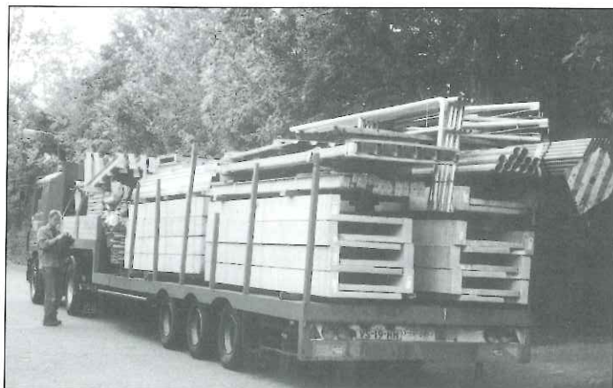
Juli 2000: aankomst van "een pakketje tribune".

Prachtig moment was toen de kraan van PAX de spanten van de bovenbouw plaatste op de poeren van de 7 funderings-units: alles paste tot op de millimeter.