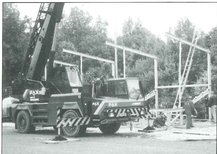
Juli 2000: opbouw tribune met mobiele kraan