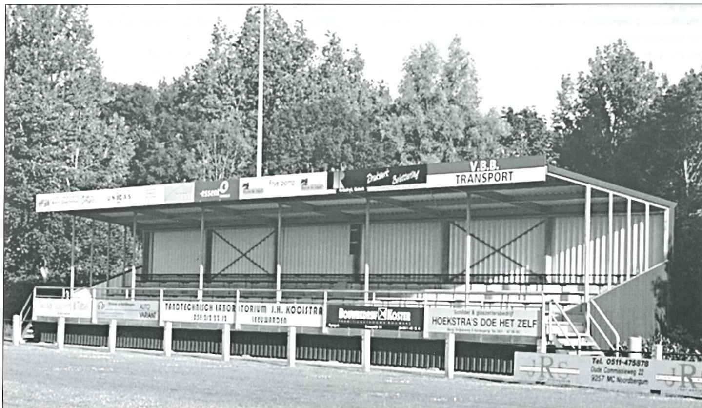
Onze nieuwe tribune: een schitterend resultaat!