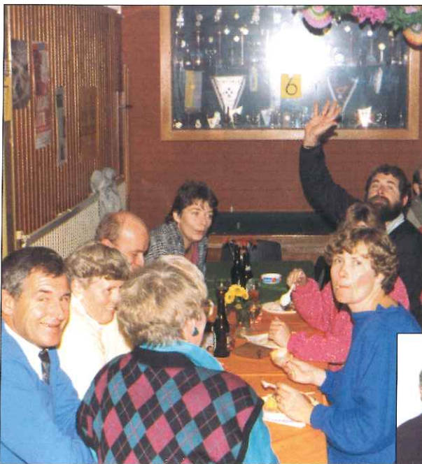
Kaderavond: Waardering voor het vrijwilligerswerk