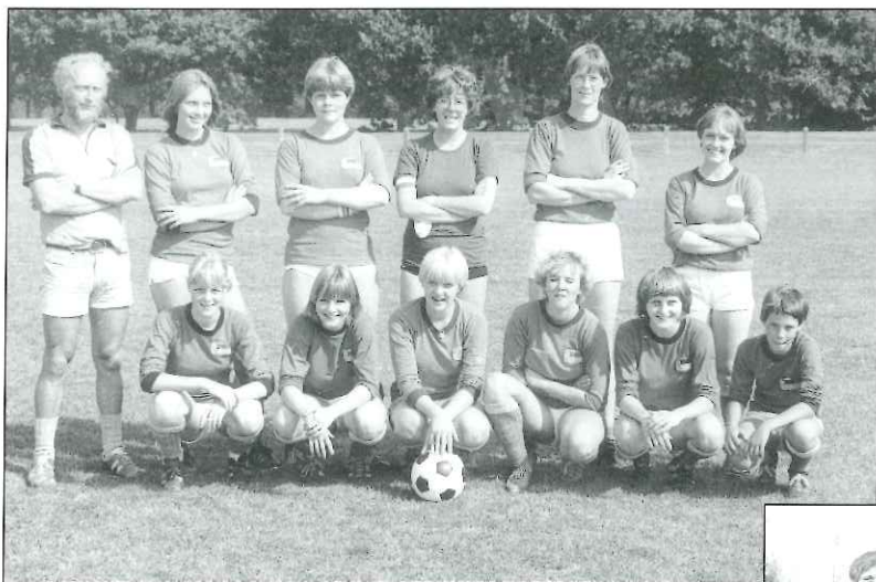
Kampioenschap E2, seizoen 1979-1980

Een nieuw fenomeen heeft hiermede zijn intrede gedaan bij de 40-jarige, waaruit opnieuw blijkt dat zij nog steeds springlevend is!