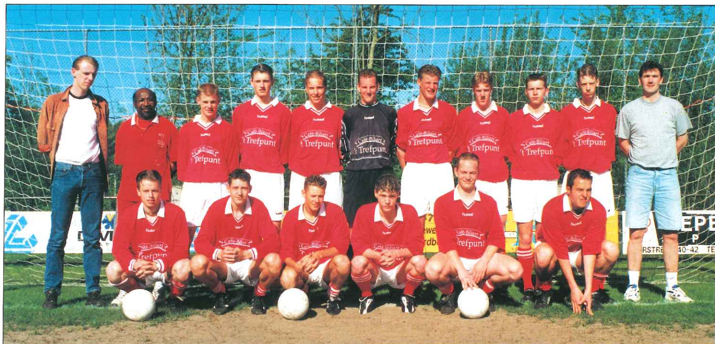
Seizoen 2000 - 2001: v.v. Hardegarij KAMPIOEN!!