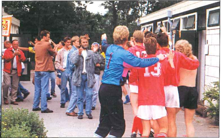
Zo kan het ook! Na de overwinning in juni 1993 op Waterpoortboys in polonaise naar de kleedboxen met de spelers van Waterpoortboys voorop.