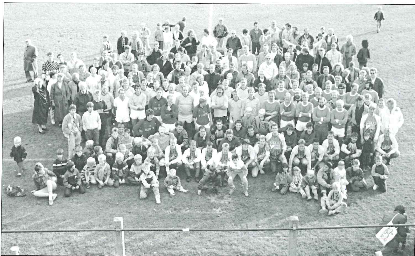
De vv Hardegarijp-familie bij het 25-jarig jubileum in 1987