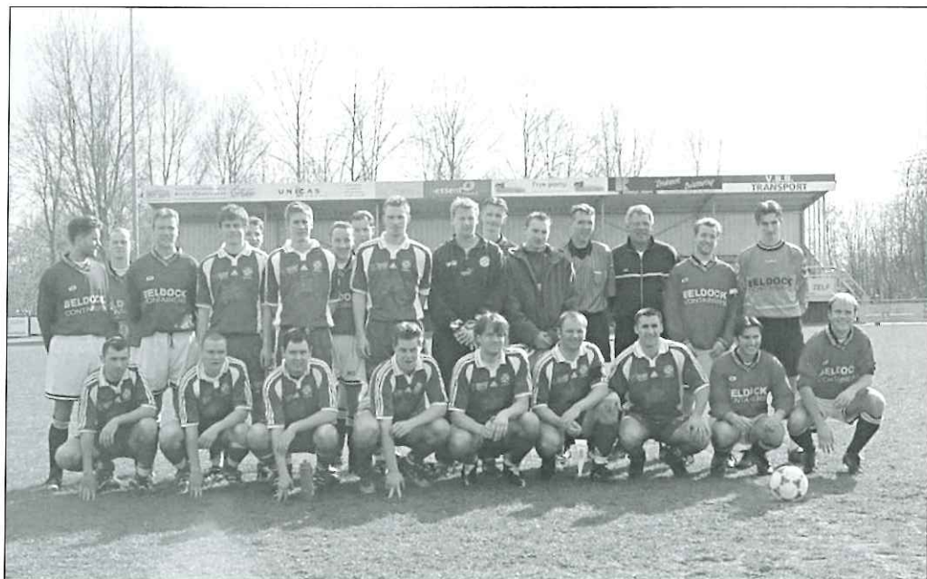
Hardegarijp-combinatie tegen Rydaholm (Zweden); maart 2002

Nu reeds staat vast dat ook het volgende voorjaar weer Zweedse teams onze gasten zullen zijn.