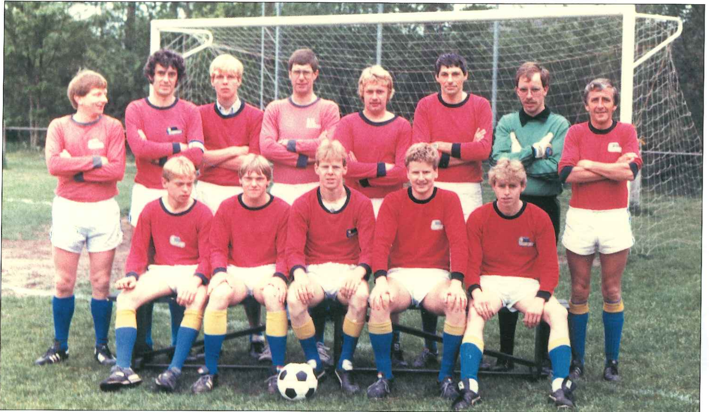
1980 - 1981: Het tenue van de voetballers werd thuis gewassen: het ene shirt is nieuw, het andere shirt moet nodig worden vervangen. Nee, we noemen geen namen, maar door de kledinglijn hopen we eenheid in het tenue te bereiken.