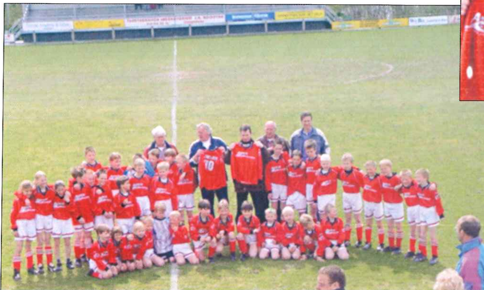
De E- en F-pupillen als eersten in het nieuwe tenue van de kledinglijn